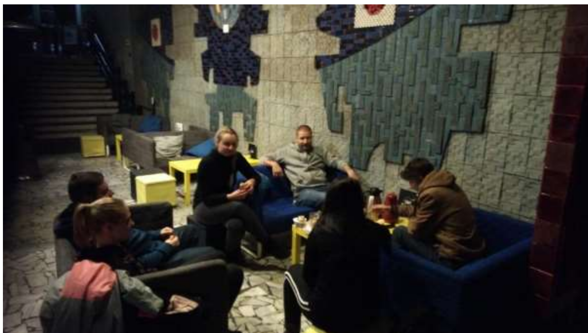
Snídaně v kině Bio Centrál.