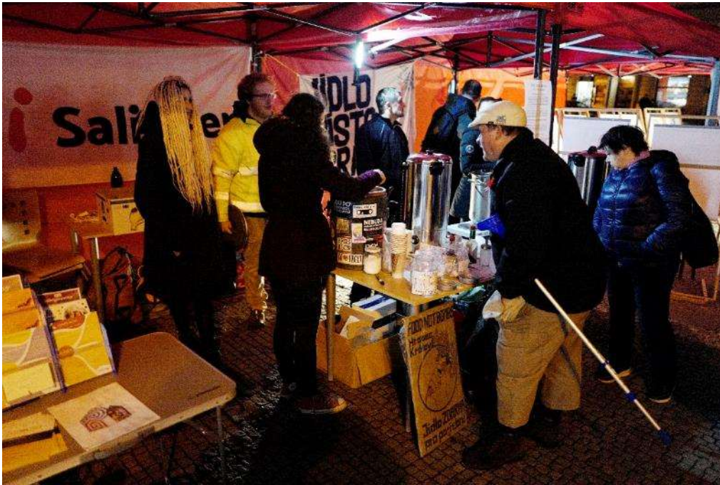
Návštěvníci u nabídky jídla Food not Bombs a gulášovky DMT.