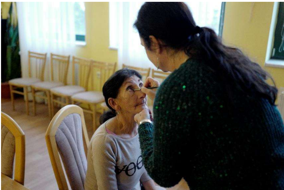
Proměna s kosmetikou Mary Key.