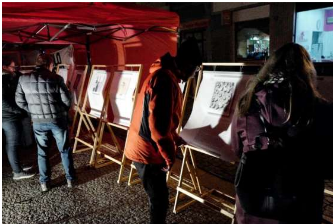
Výstava osudů lidí bez domova s ilustracemi od žáků ze ZUŠ Střezina.