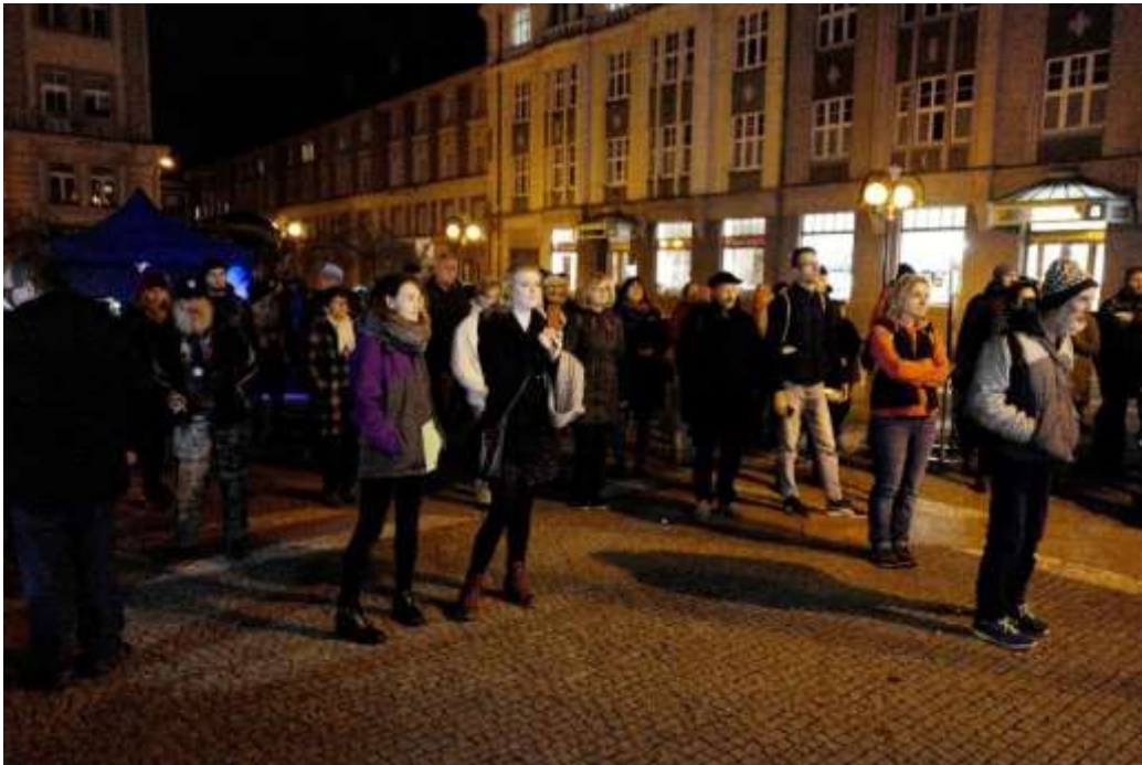
Noc venku podpořila svoji návštěvou veřejnost i uživatelé sociálních služeb.