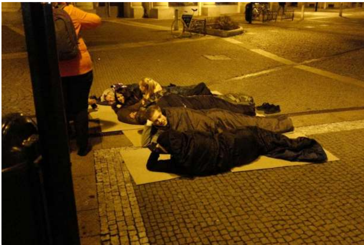
Příprava ke spánku. Nakonec na Baťkově nám. spalo 14 lidí.