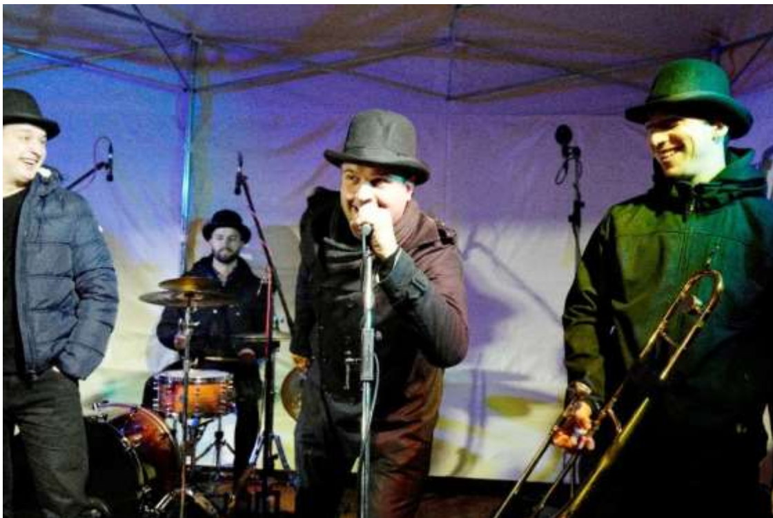
Vystoupení dixielandové kapely Black Buřinos.