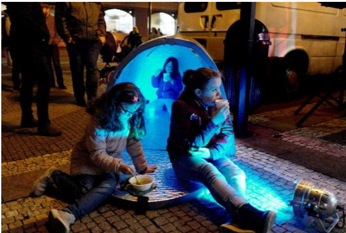
Ukázka iglů, které dokáže udržet teplotu o cca 15 stupňů vyšší než je teplota venku.