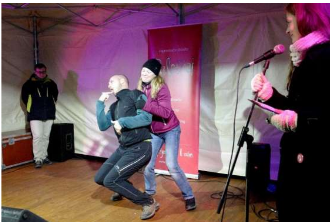
Vystoupení improvizální skupiny Paletáci.